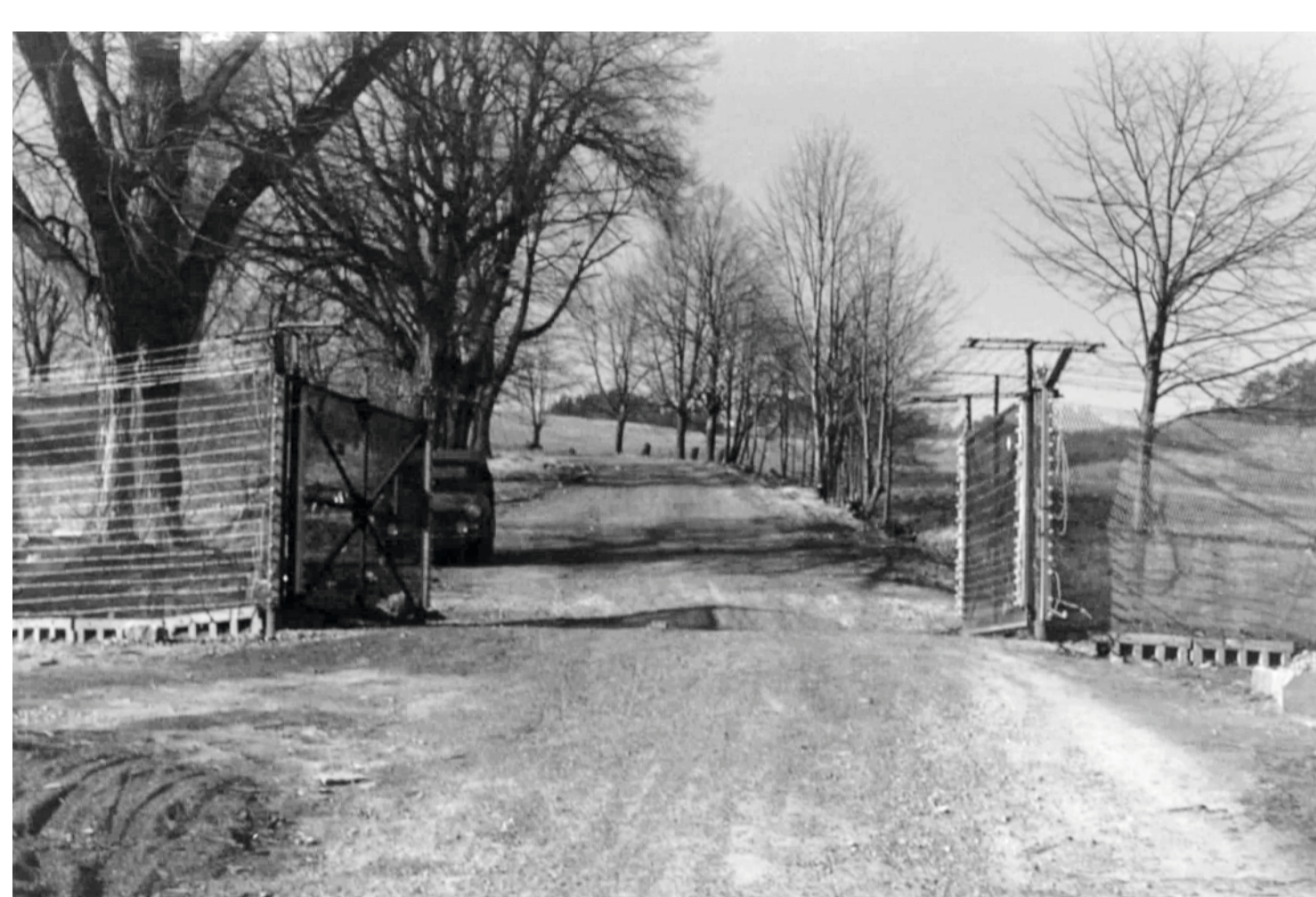
500m Streifen