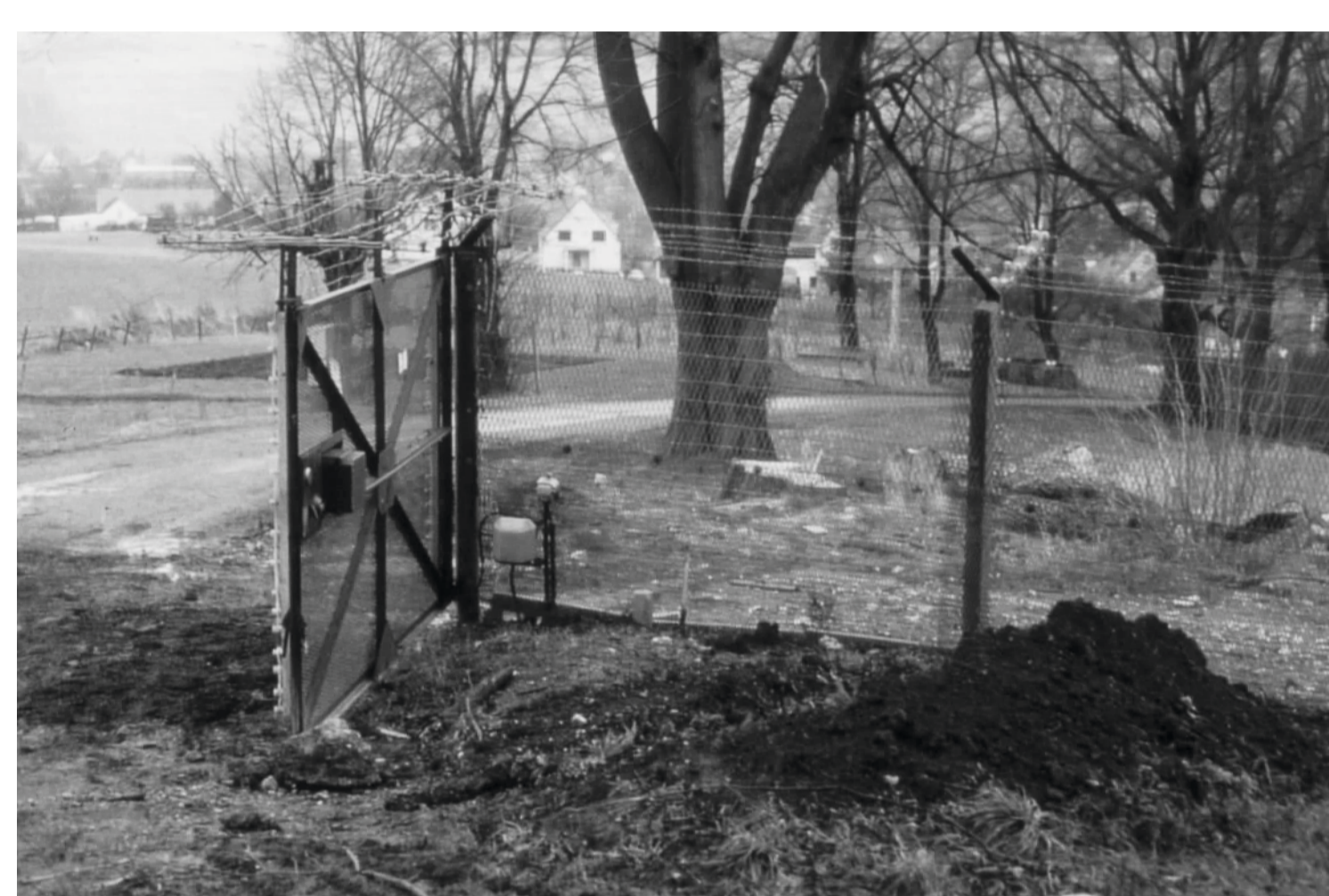
500m Streifen

Today the Rasdorfer Street to Point Alpha is freely passable. There is the opportunity to experience the history of the Cold War and the divided Europe with all your senses.