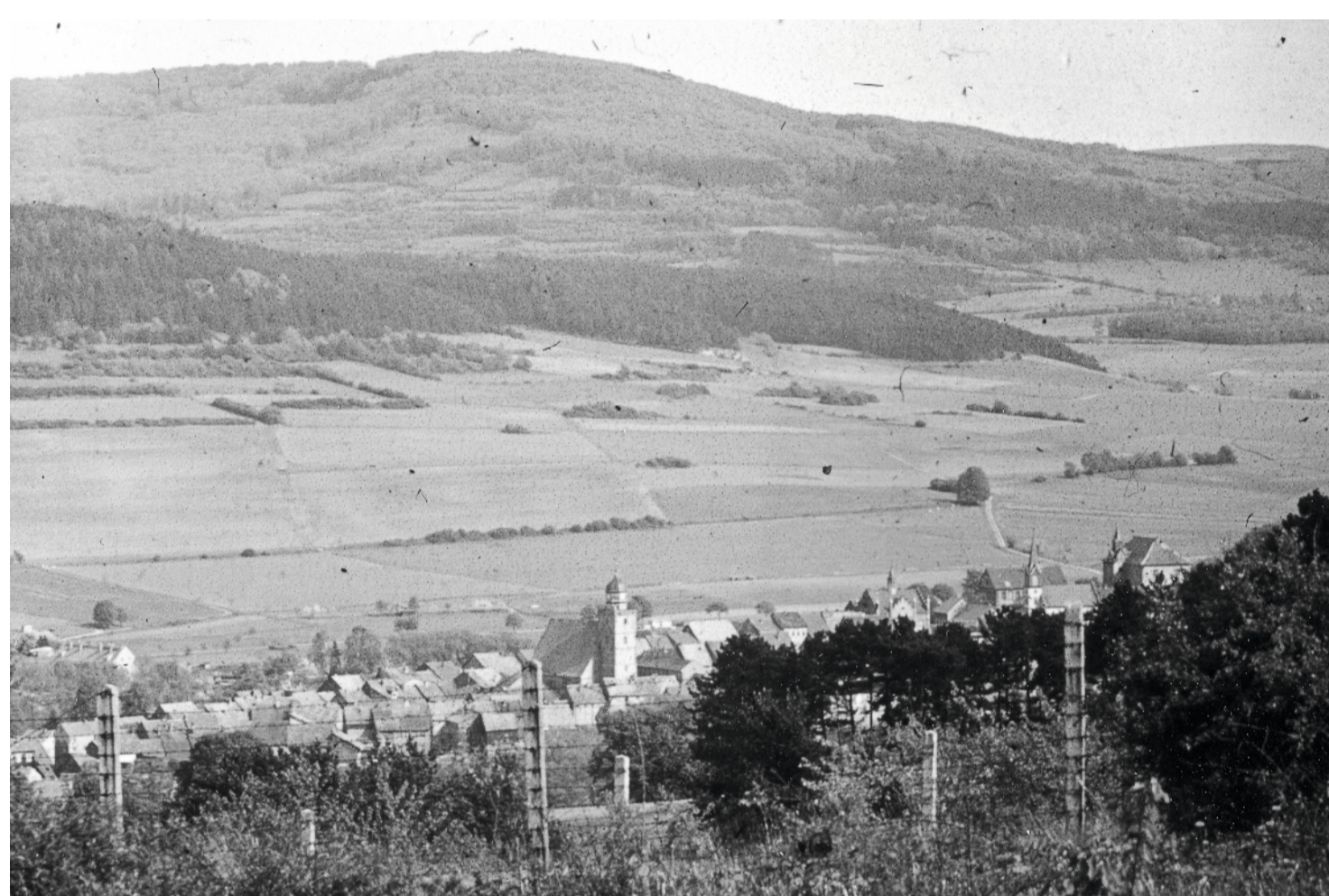
Sicht auf Geisa vom Rasdorfer Berg, im Vordergrund Grenzanlagen Foto: Hugo Scholz, 1975 | Quelle: Sammlung Mathilde Hahn