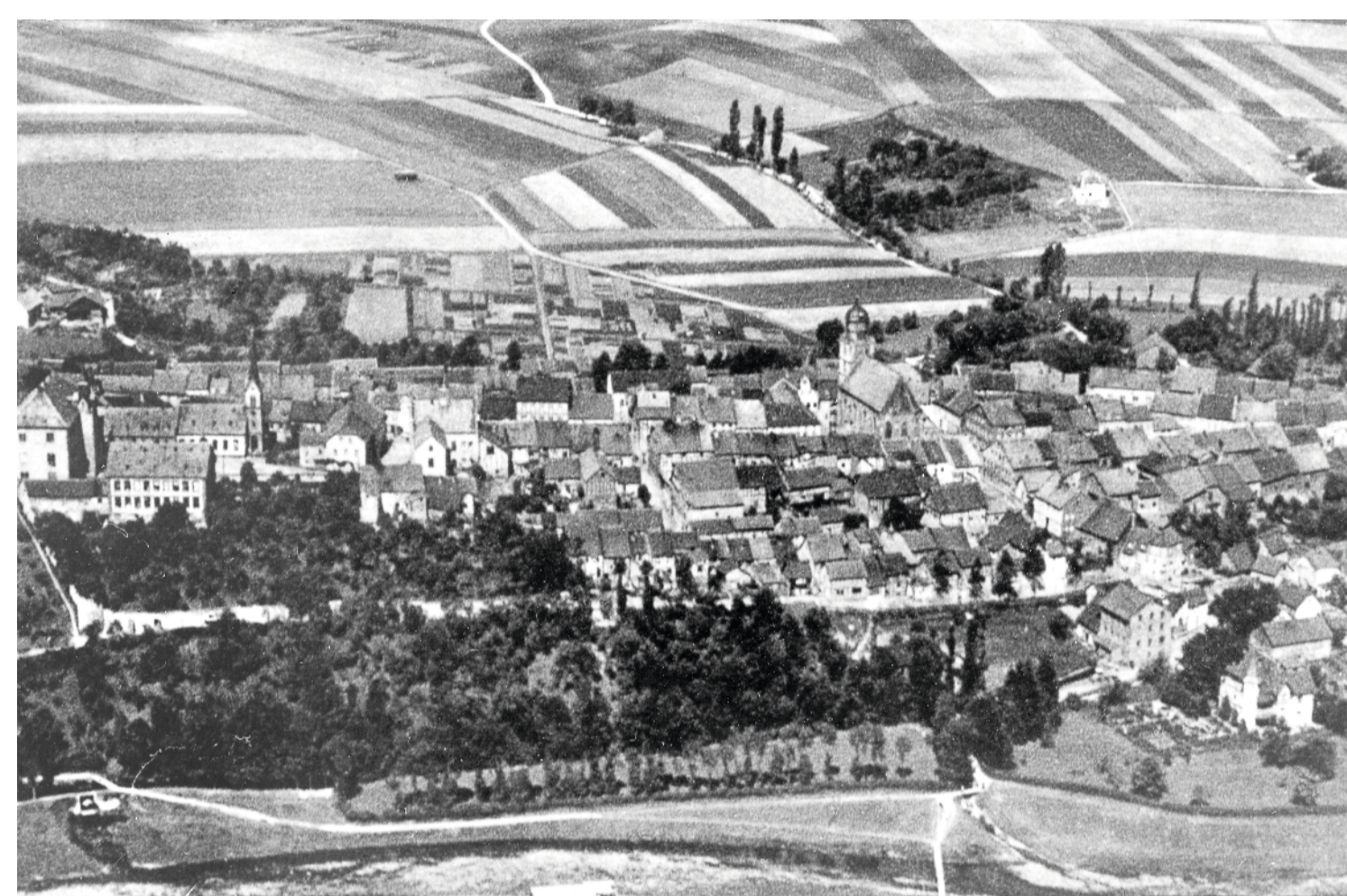
Luftaufnahme aus östlicher Richtung

Zur Stadt Geisa gehören heute die Ortsteile Geisa, Geismar, Borsch, Bremen, Otzbach, Geblar, Wiesenfeld, Spahl, Reinhards, Ketten, Walkes und Apfelbach.