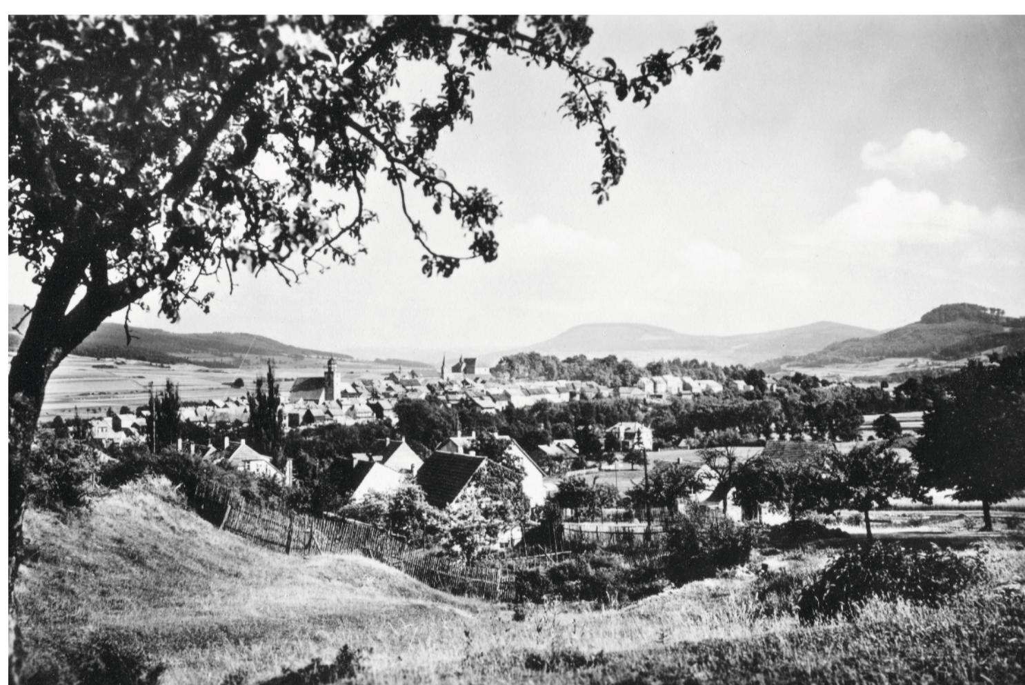
Blick vom Rasdorfer Berg

From the memorial the Point Alpha trail leads back to the starting point in Geisa.