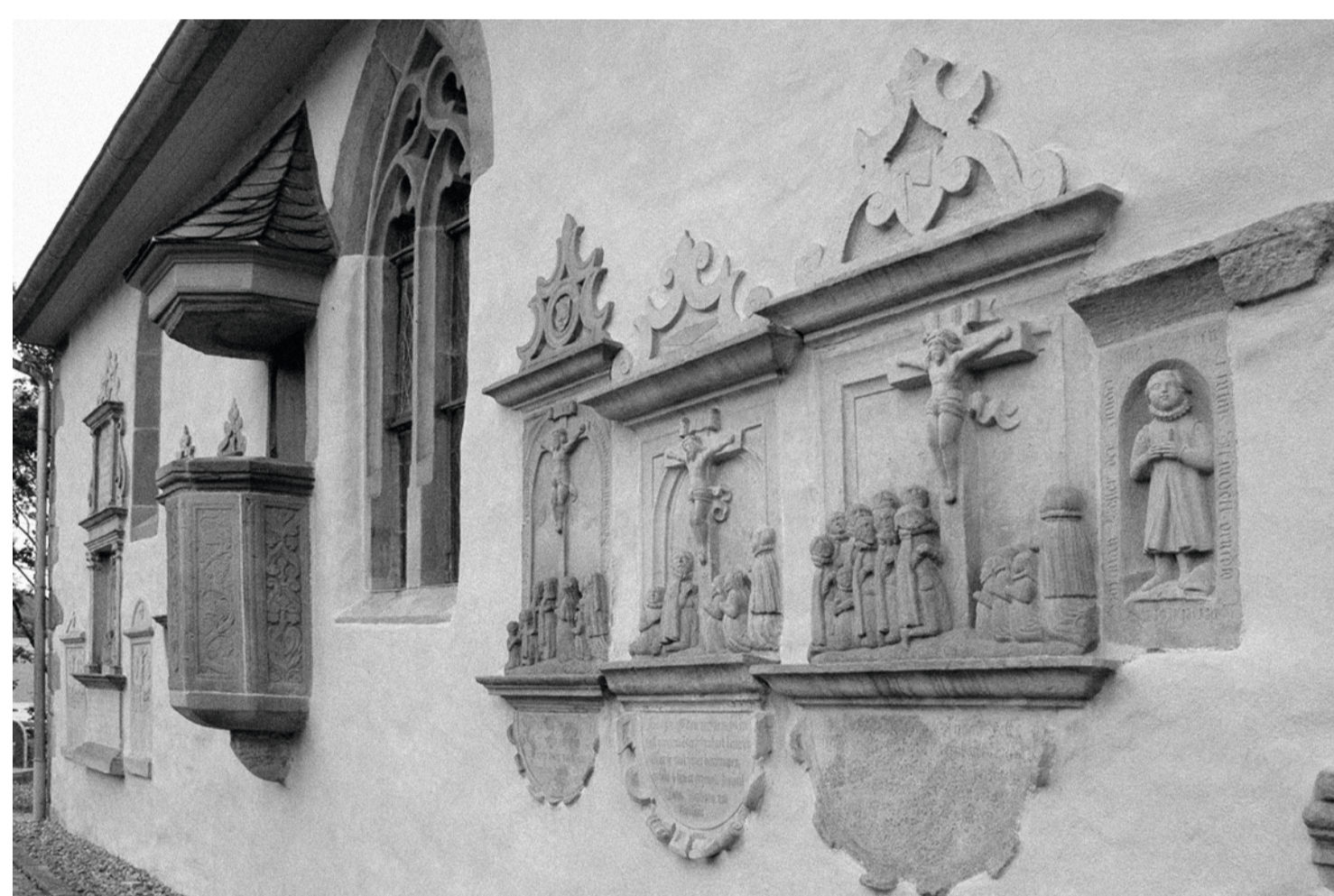
Kanzel und Epitaphen an der Nordwand der Gangolfikapelle Quelle: Annett Sachs

Quellen: Mathilde Hahn; Geisa 1175 Jahre